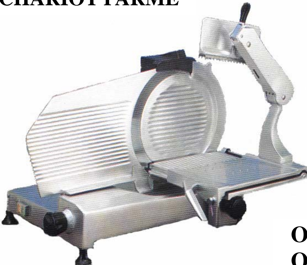
OSV 300 OSV 350